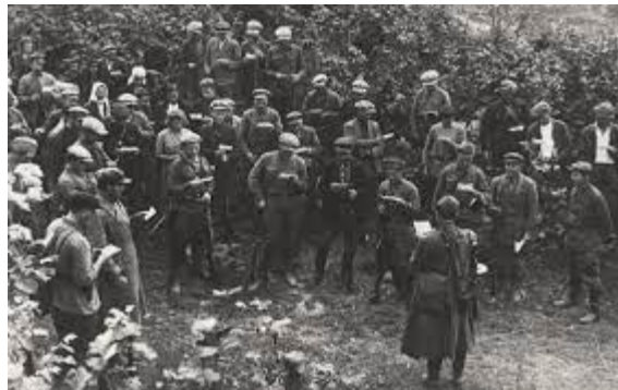
Присяга советских партизан 1941 год

Этот акт считался самым торжественным событием в жизни красноармейца.